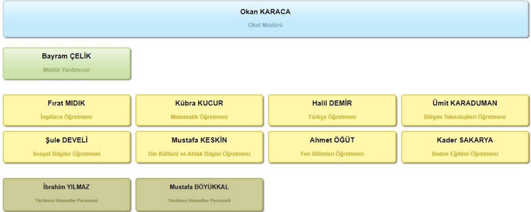
Şekil 1: Organizasyon Şeması