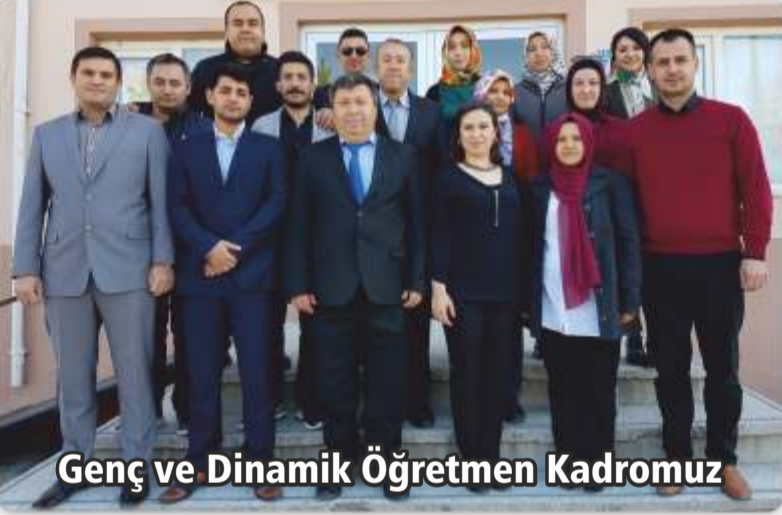
Genç ve Dinamik Öğretmen Kadromuz

Eğitimde kaliteyi arttırmak, hedeflediğimiz başarıya ulaşmak için genç, dinamik eğitim kadrosu ve başarılı öğrenci profili ile okulumuz adım adım zirveye koşuyor.